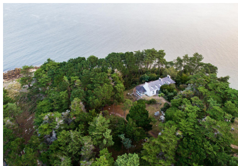
La résidence Magnetic à la pointe du Dourven, en Bretagne.